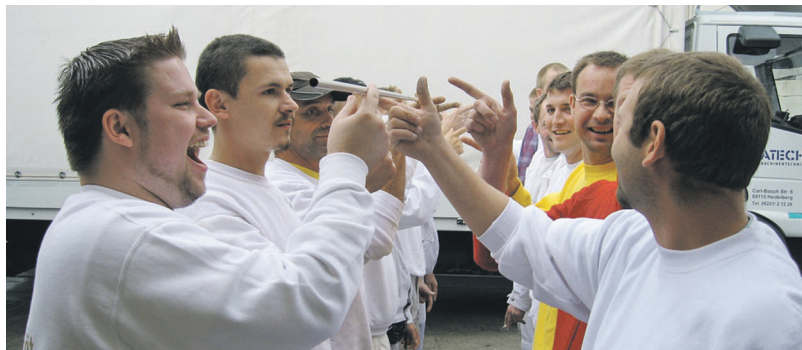
Mit Rücksicht auf Einzelne entsteht geballte Manpower.

Der Ansatz trug schnell Früchte. So kann der Betrieb nie über mangelnde Bewerbungen klagen – im Gegenteil: „Ich schreibe schon gar keine Stellen mehr aus, sonst laufen der Konkurrenz die Maler weg“, sagt Hauck. Die Fluktuation im Betrieb geht gegen null. Die Angestellten scheinen gerne zur Arbeit zu kommen, sind morgens pünktlich und gut gelaunt und tragen stolz ihren