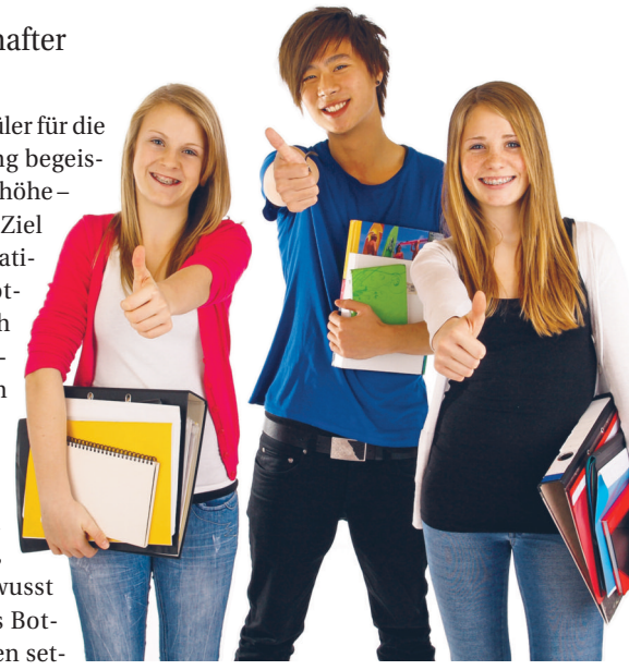
Werben macht Spaß – Ausbildungsbotschafter sind auch im Handwerk gesucht.

Eingesetzt werden sollen Azubis aus dem zweiten und dritten Lehrjahr, die bereits fachliche Erfahrungen sammeln konnten und auch die persönlichen Voraussetzungen mitbringen, um vor einer Klasse ihren Beruf authentisch und spannend zu präsentieren. Um die künftigen Ausbildungsbotschafter optimal auf ihre Aufgabe vorbereiten zu können, erhält jeder Aspirant eine einjährige Schulung, in der ihm unter anderem Kenntnisse in Rhetorik und Präsentationstechniken sowie grundlegende Daten und Fakten zum Berufsbild und zu Weiterbildungsmöglichkeiten vermittelt werden. Die anschließenden Einsätze an den allgemeinbildenden Schulen werden jeweils von einem re-